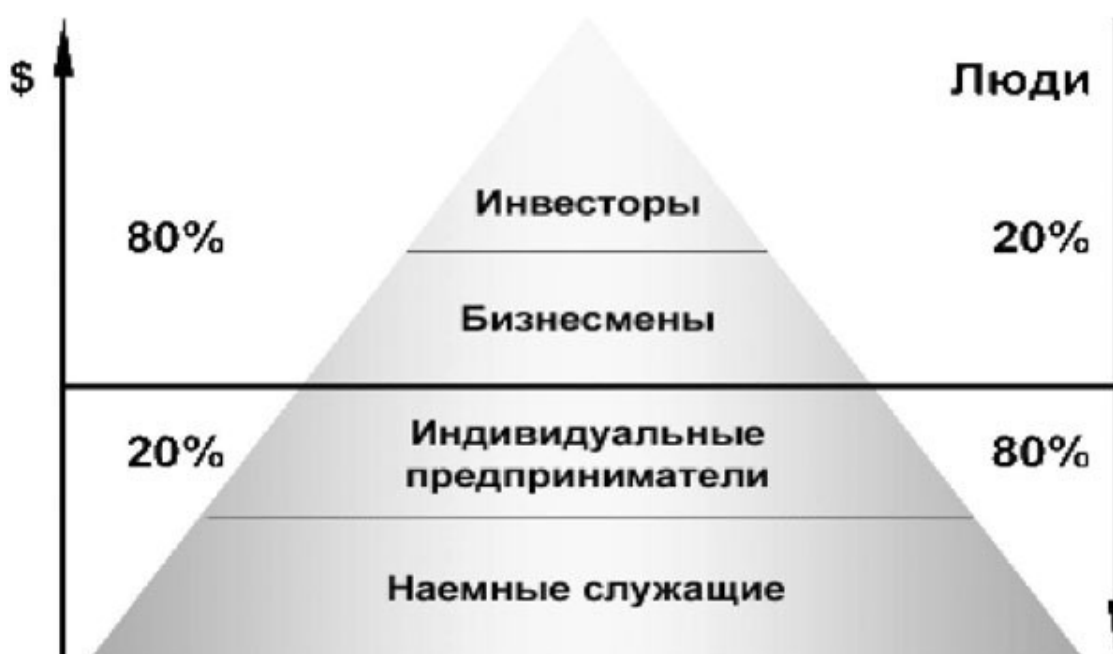
Рис. 1. Распределение денег

Рассмотрим нескольких уровней распределения денег между населением.