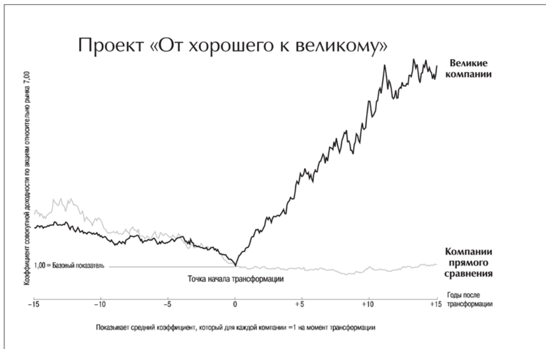
График 1. А

Концепция проекта схематично показана на графике 1.А 3 . Мы выбрали именно те компании, которым удалось осуществить переход от хороших результатов к выдающимся и сохранять эти высокие результаты в течение по крайней мере пятнадцати лет. Мы сравнили показатели деятельности этих компаний с показателями группы тщательно отобранных компаний, которым не удалось осуществить подобного перехода или удалось, но они не смогли удержаться на этом уровне 4 . Затем мы проанализировали те факторы, которые позволили компаниям перейти из разряда хороших в разряд великих и стали определяющими для их долгосрочного успеха 5 . (См. таблицу «Проект “От хорошего к великому”».)